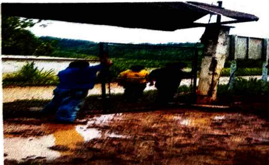
Foto 5: se observa un muro perimetral en deterioro por el pasar de los años.