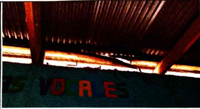
Foto 1: Se observa el deterioro y desprendimiento de los caballetes el modulo 2, debido a mucho comejen.