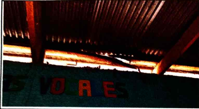
Foto 1: Se observa el deterioro y desprendimiento de los caballetes el modulo 2, debido a mucho comegen.