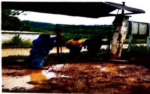
Foto 5: se observa un muro perimetral en deterioro por el pasar de los años.