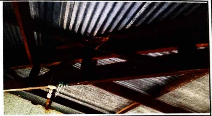
Foto 2: El deterioro de las costaneras, debido a los años que tiene desde su elaboración.