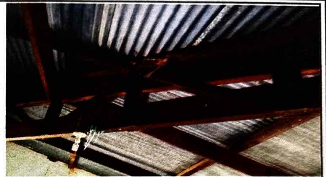
Foto 2: El deterioro de las costaneras, debido a los años que tiene desde su elaboración.