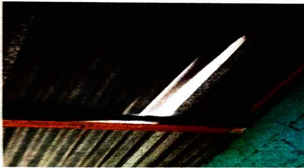
Foto 3: Se observa el desprendimiento de laminas en el techo de las aulas y pasillos.