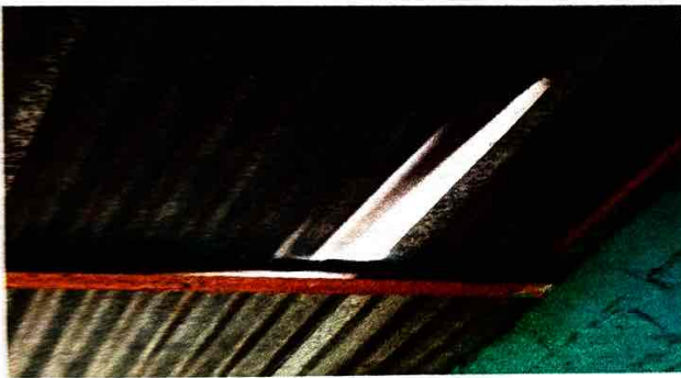
Foto 3: Se observa el desprendimiento de laminas en el techo de las aulas y pasillos.