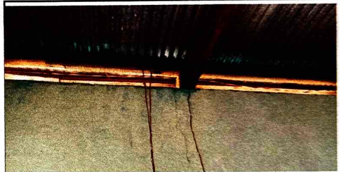
Foto 4: es legible el mal estado del cableado y con el pasar del tiempo se ha ido deteriorando. Es de utilidad por el uso de la misma en aula de computación.